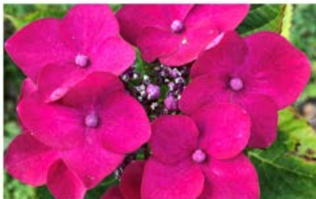
Eryngium planum (28-8-21), Amaryllis Belladonna, et hortensia