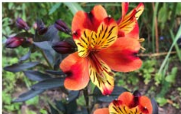
Crocosmia Davidson jaune, cardon et alstromère