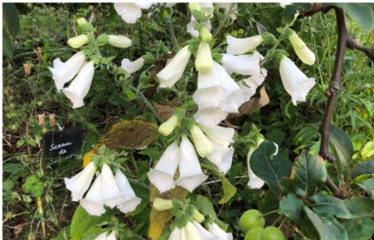
Page de gauche, hortensias variés et ci-dessus, digitale