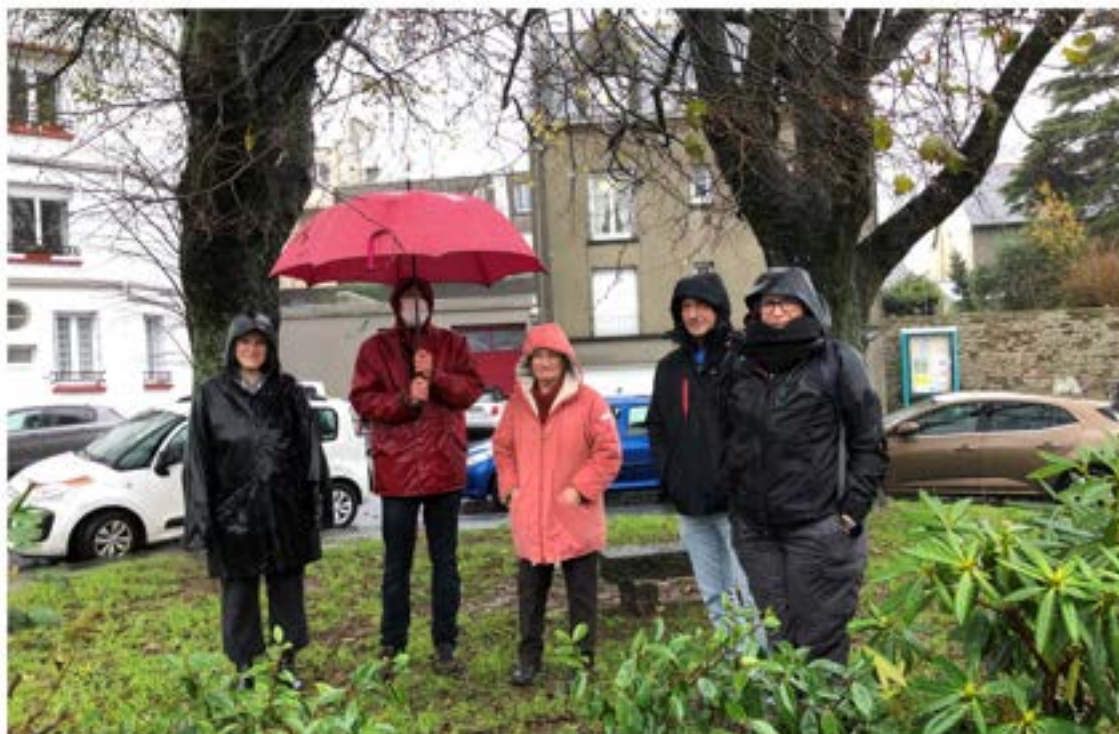
Page de gauche : 25 septembre, troc d'automne du Rond de Jardin. Ci-dessus : 5 décembre, visite du jardin par le groupe Regain (BV)