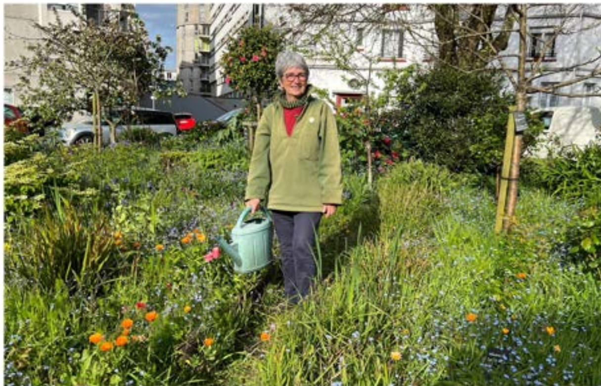
A gauche : 9 avril, troc de printemps, Viburnum plicatum et Fritillaria meleagris . Ci-dessus, 11 avril.