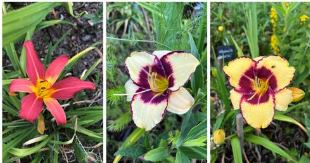
Hémérocailles (jardin Keriel, Plouédern) fin juin 2022