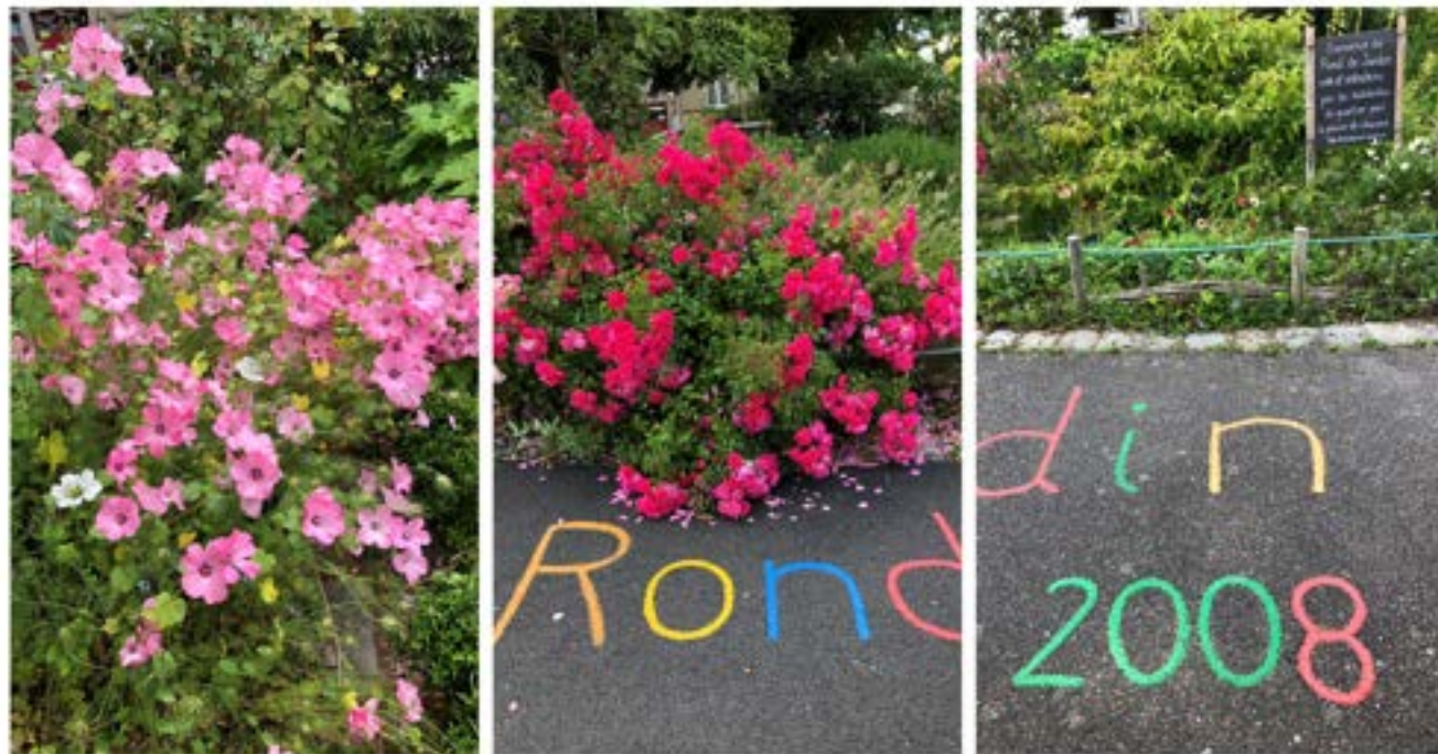
Lavatières, rosiers Emera et panneau de bienvenue