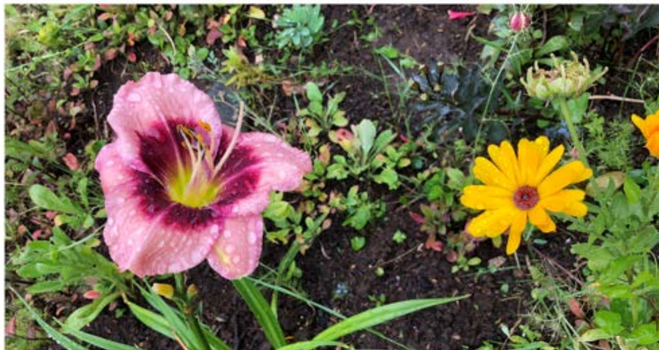
Hémérocalle (beauté d'un jour !) et agapanthes début juillet 2021